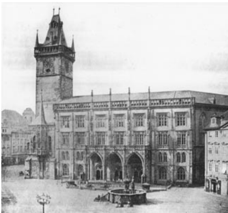
Východní křídlo Staroměstské radnice v roce 1856.

Další oblastí, kde může sehrát občanská angažovanost klíčovou roli, je snaha o nápravu škod spáchaných na podobě historických měst bezohlednými novostavbami, a to zejména těmi z období totalitní vlády komunistického režimu. Jako zahraniční příklad může opět posloužit sousední Německo, konkrétně dlouho diskutovaný případ znovupostavení berlínského městského zámku. Tato velkolepá historická stavba, neodmyslitelně spjatá s dějinami města, byla vážně poškozena na konci druhé světové války