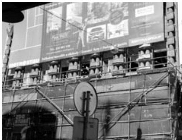
Detail fasády, září 2006.