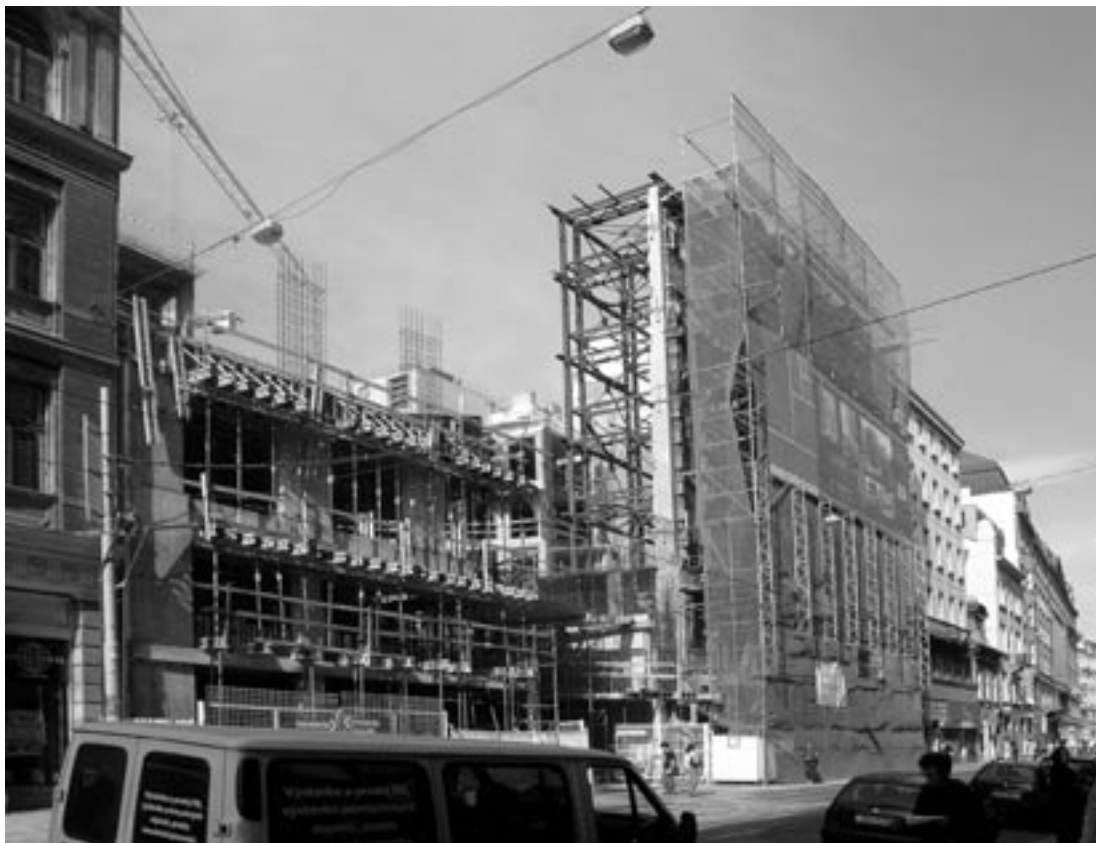
Fasáda po další fázi redukce hmoty, září 2006.

válečkem, který připomínal záclony a dojem mělo zlepšit několik barevných fleků nahrazujících květiny.