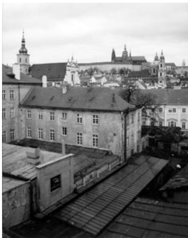
Výhled z areálu kláštera k Pražskému hradu. Stav 1999 a 2006.