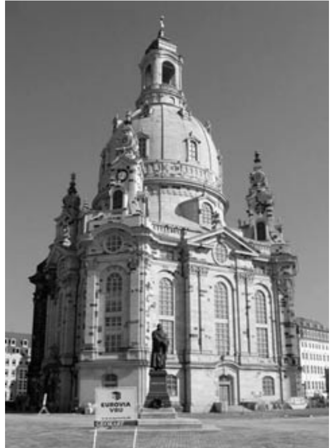
Obnovený Frauenkirche v roce 2006.