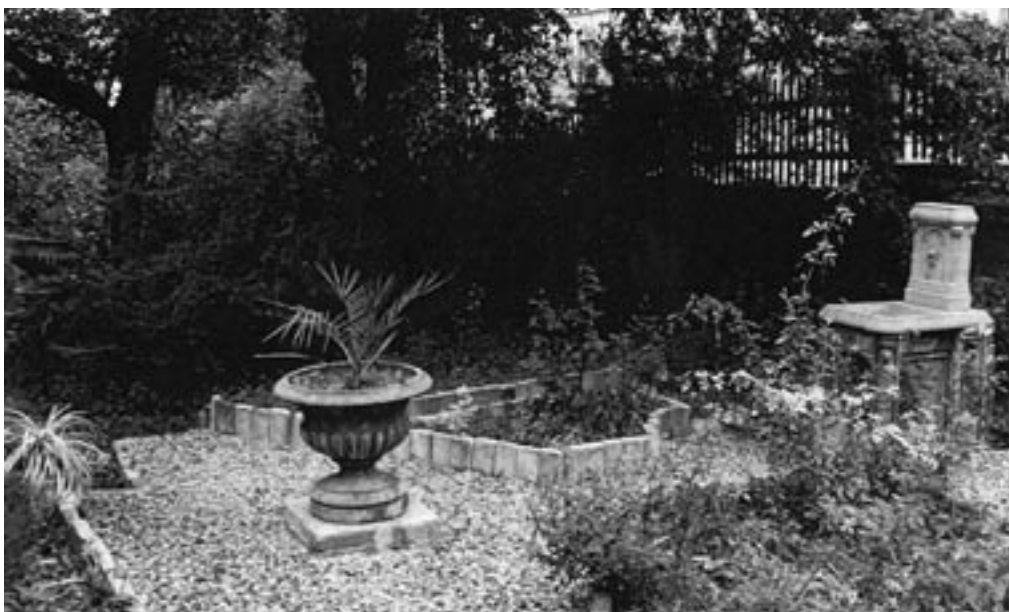
Francouzská zahrádka v září 1988 s negotickou fontánou. Vše odcizeno v 90. letech 20. století.

R. Biegel v jmenovaném článku správně zdůrazňuje trojdílnou dispozici domu venkovského typu (mj. v Praze vzácností). U příměstských usedlostí bud' převažoval