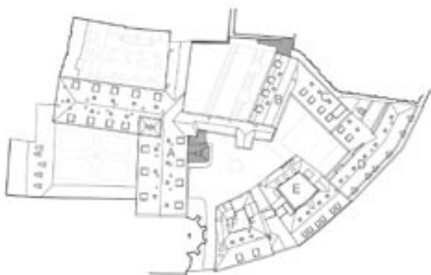
STŘECHY - PŮVODNÍ PODOBA PROJEKTU

Rekapitulují-li největší neduhy celého záměru, jedná se o propojování více historicky samostatných objektů, nadměrná navrhovaná kapacita vedoucí k zastavení dosud volných půdních prostor s cennými historickými krovky, exploatace archeologických terénů, zastavování vnitřních dvorů a bezohlednost vůči dochovanému autentickému inventáři budov, jako jsou historické dveře a okna, podlahy, krov a podobně.