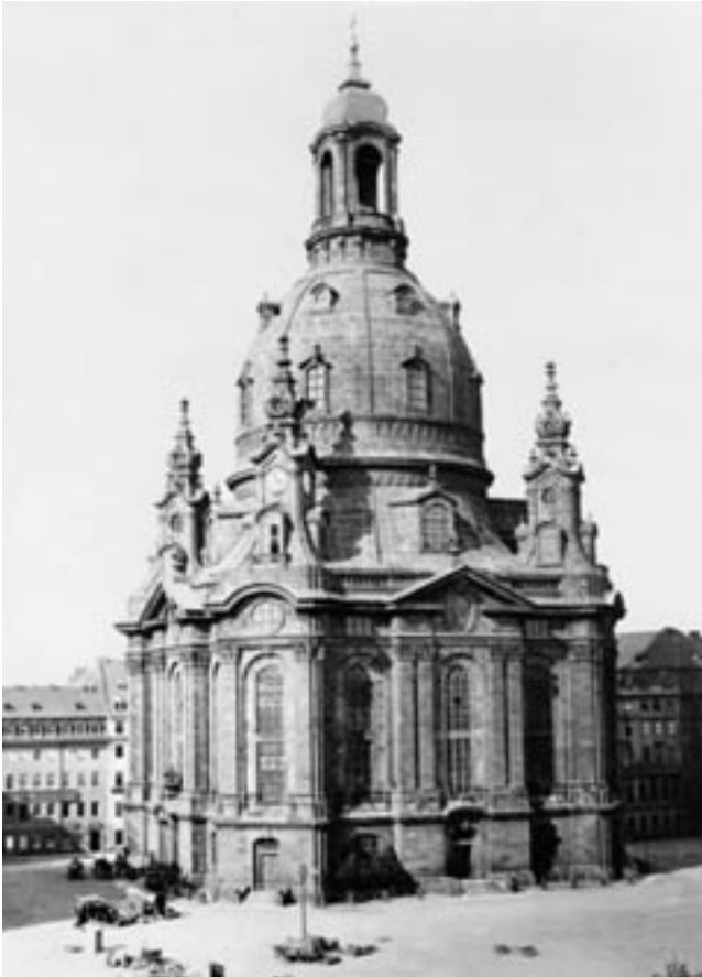
Drážďanský Frauenkirche v roce 1943.

Nalezneme srovnatelný příklad obnovy zničené významné památky i v naší zemi? Podobný osud jako drážďanský Frauenkirche měla Staroměstská radnice v Praze, poškozená střelbou a následným požárem 8. května 1945. Zatímco nejstarší část byla hned po válce pietně obnovena, novogotické křídlo do Staroměstského náměstí bylo ukvapeně strženo a ponechána zůstala jen jedna okenní osa jako připomínka válečných hrůz. Na rozdíl od Frauenkirche se však tato část radnice po pádu komunistického režimu obnovy nedočkala a její místo tak nadále zabírá parčík, nevhodně suplující chybějící západní stranu náměstí. Od konce druhé světové války se konaly čtyři architektonické soutěže a objevily se desítky návrhů na dostavbu Staroměstské