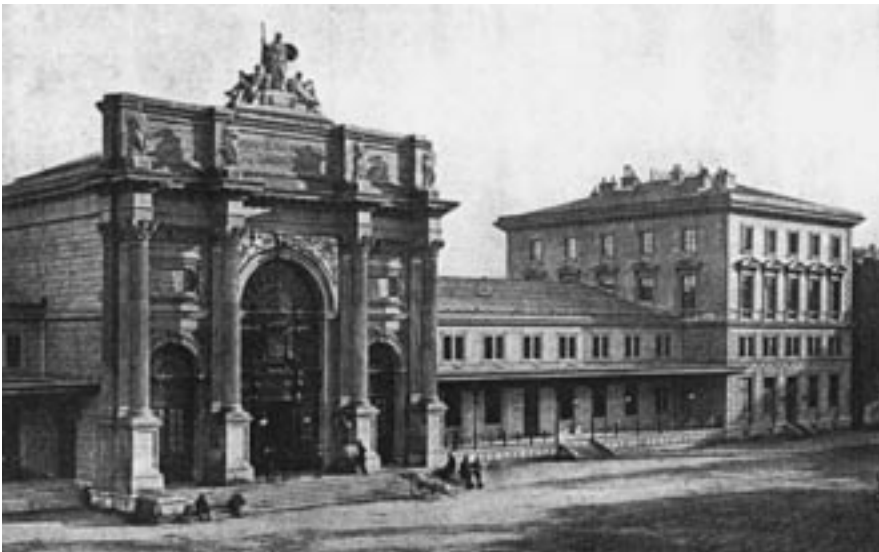
Průčelí nádraží Těšnov v roce 1876.