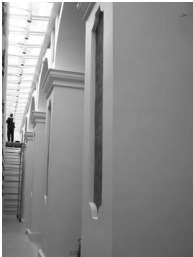
Křížová chodba, exteriér, 2006.

vnímání celé stavby. Až při prohlídce této stavby jsem si uvědomil, jak ošidné může být rozlišování zásahů na vratné a nevratné, respektive podstatné a nepodstatné. V nynější podobě bude stavba patrně existovat desítky let. Jedinečnost, která se ukrývá pod sjednocenými interiéry, bude vnímat jen několik poučených hostů. Pracovníci památkového ústavu přitom v tomto případě odvedli obrovský kus práce, když se jim podařilo mnohé z osobitosti jednotlivých částí uchovat. Na hotelové hosty, uvyklé na shodnou uniformitu svého hotelového řetězce, bude nový pražský hotel možná působit osobitě až odvážně. Na kohokoli jiného, kdo má zkušenost s živoucí historickou stavbou, však naopak nejspíš chladně, dokonce možná sterilně. Neexistuje samozřejmě jeden ideální vkus, pro který bychom měli památky opravovat.