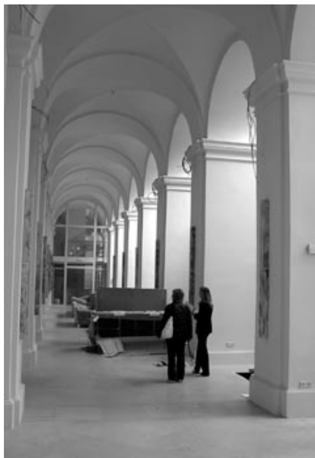
Křížová chodba, interiér, 2006.

Výraznou změnou prošel projekt přestavby sousedního domu čp. 387-III při Karmelitské ulici. Stavebně-historický průzkum zde odhalil dochované zdivo renesančního kostela, který se podařilo po dohodě s investorem