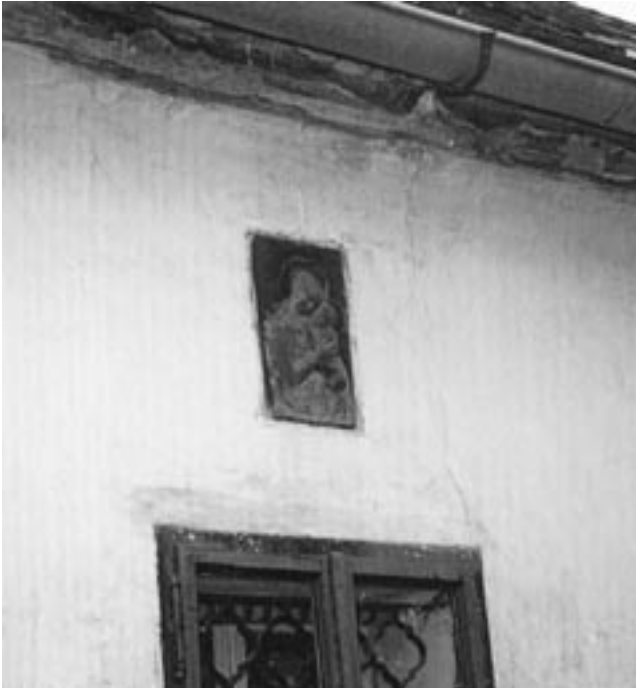
Měděný reliéf Madony nad středním oknem uličního průčelí.

ského kláštera a patřila mezi nejstarší viniční usedlosti, stejně jako klášteru náležející usedlost Tejnka, z níž zůstala dnes jen větší zahrada a názvy ulic Tejnka a Nad Tejnkou. Se Závěrkou to přes veškerou snahu dopadlo obdobně. Dala název ulicím Závěrka a Nad Závěrkou a název hospodě na rohu Šlikovy a Za Strahovem.