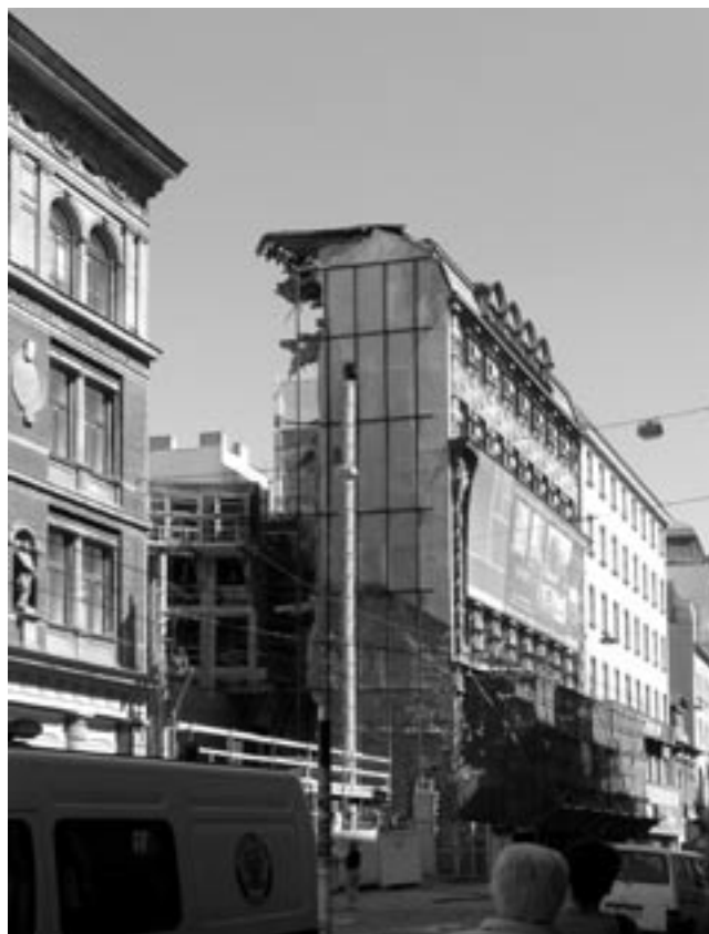
Torzo budovy Myšáka po zřícení v polovině července 2006.

Zanedbané domy se nechají patřičně dozrát a pak se v rámci neopravitelnosti začínou redukovat. Míra redukce je závislá na potřebách nových dispozic, a tak mnohdy z domu zbude zkomolená fasáda nebo nějaký zajímavý