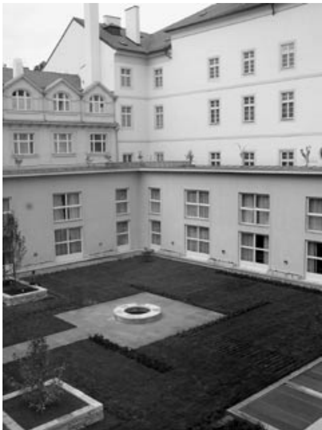
Nádvoří – bývalý rajský dvůr, 2006.