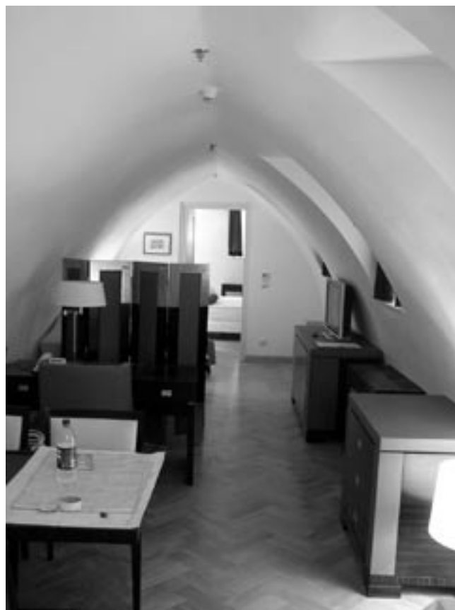
Gotizující dřevěná klenba, 2006.