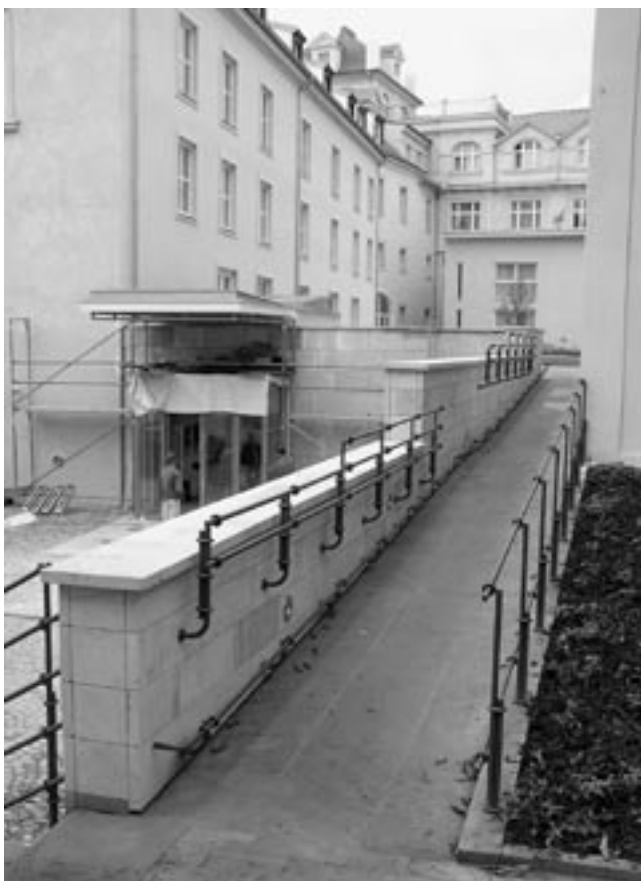
Rampa a hlavní vstup, 2006.

ňuje tmavý dřevěný nábytek, který svým charakterem připomíná těžkopádné interiérové kreace osmdesátých let minulého století a který spolehlivě přebíjí případnou prostorovou kvalitu historických místností. Je ovšem nutno říci, že nábytek byl dodán zahraniční firmou na přání investora a nemá tak s projektem rekonstrukce nic společného. Velmi zdařile naopak dopadla obnova barokního schodiště, jehož jedinečnost je umocněna právě uniformitou ostatních prostor.