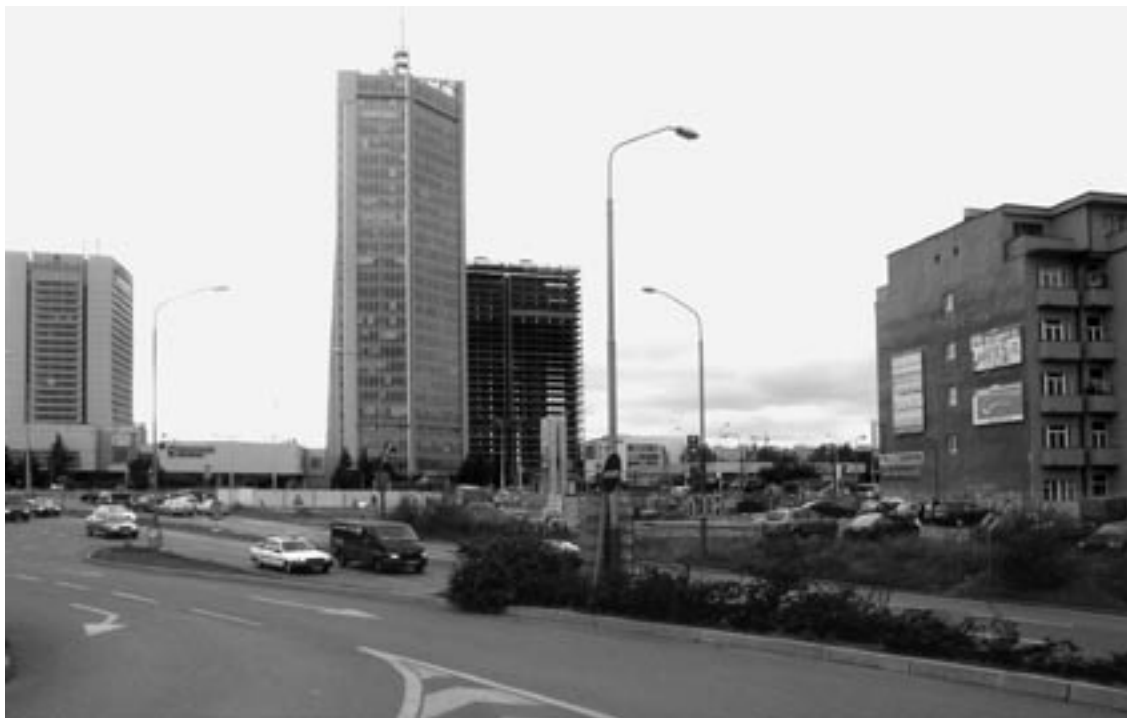
„Odkudkoli se podíváš, nikdy oko nepotěšíš.“ Trojice pankráckých výškových budov v září 2006.

Ve prospěch stavby mrakodrapů na Pankrácké pláni bylo v poslední době publikováno více stanovisek a názorů, které se snaží přesvědčit, že se jedná o přínosný záměr. Tak tomu ale není. Existují objektivní námitky, které zpochybňují nejen přínos, ale samu přijatelnost takového záměru.