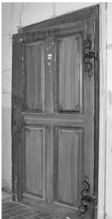
Jedny z kompletně zachovaných barokních dveří klášterních cel ve východním křídle konventu. Klub kladl důraz zejména na zachování cenných dveří v jejich původním umístění.

Barokní schodiště ve spojovacím křídle mezi objekty A a B bude nahrazeno novým schodištěm železobetonovým. Cenný historický řemeslný prvek se nepodařilo NPÚ ani Klubu uhájit.