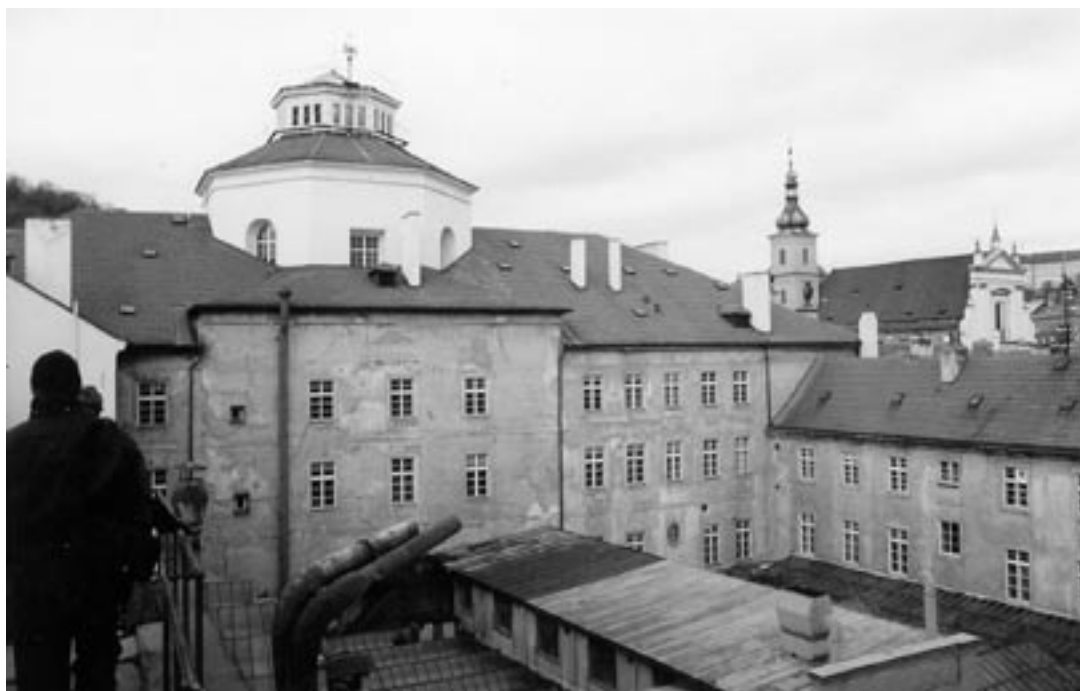
Kostel sv. Maří Magdalény z nádvoří. Stav 1999 a 2006

Výchozím bodem této velké rekonstrukce byl žalostný stav budov bývalého kláštera, který byl v 19. století přeměněn na tiskárnu a sloužil tak jako průmyslový objekt. Od počátku tedy bylo jasné, že investice na případnou rekonstrukci areálu bude výrazně vyšší, než by tomu bylo v případě pouhé obnovy nevyužívaných, avšak nepřestavěných budov. O počátku se také nepočítalo se zapojením bývalého barokního kostela sv. Maří Magdaleny, který původně tvořil nejdůležitější stavbu areálu a který byl v nedávné době rekonstruován pro účely Muzea české hudby. Rozsah novostaveb, stanovený poslední verzí projektu, byl v tomto kontextu přijatelnou daní za záchranu kláštera. Architektonický ateliér