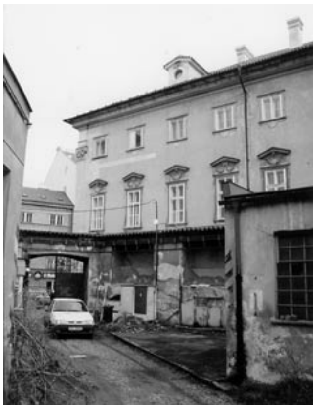
Vstupní dvůr od nároží Nebovidské a Harantovy ulice. Stav 1999 a 2006.

Při přestavbě byla skutečně obnovena křížová chodba a šťastný nálezy na fasádě umožnil dokonce rekonstruovat její vnější architektonické členění. Kvůli schodišti do patra však byla proražena klenba jejího posledního pole a účín arkád byl výrazně snížen přidáním neplánovanou protipožární stěnou, která je oddělila od křídel dvoupodlažní novostavby. K negativům je nutno přičíst i nezvládnuté architektonické detaily a nepochopitelné použití velmi hrubých a disproportionálních rámu skleněných dělicích stěn. Historické klenby složitého areálu byly jinak respektovány a dle možností zapojeny do jednotlivých apartmánů, přičemž nejpozoruhodnější je v tomto směru patrně apartmá s dřevěnou gotizující klenbou, vestavěnou v 19. století do krovu jednoho z křídel (překvapivé plus!). Celkově však prošly všechny prostory pro hosty chladnou estetickou unifikací, která přinesla sjednocení dveří, oken, podlah, klik a dalších