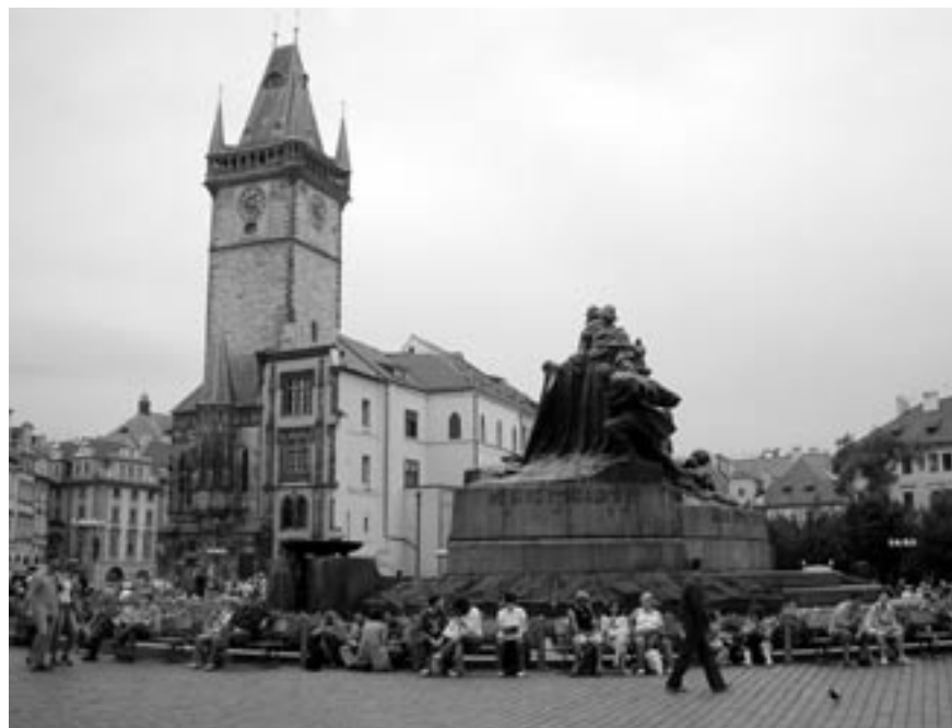
Parčík na místě východního křídla Staroměstské radnice v roce 2006.

a zbourána v roce 1950, aby uvolnila místo Paláci republiky, postavenému o více než dvacet let později. Megalomanská stavba nevalné architektonické hodnoty se stala symbolem východoněmecké socialistické republiky a hned po pádu komunistického režimu se ozvaly hlasy volající po jejím stržení. Tato myšlenka rychle získala mnoho příznivců i odpůrců a vyvolala všeobecnou diskusi o osudu chátrajícího kolosu. Za účelem znovupostavení berlínského zámku byla založena organizace, které se v roce 2002 podařilo prosadit svůj záměr v německém Bundestagu. V současné době jsou pořádány veřejné sbírky doprovázené velkými mediálními kampaněmi, zpracovávají se podrob-