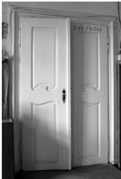
Dvoukřídle pozdně barokní dveře z obytného křídla Pivovaru u sv. Tomáše. Dveře mají být po zrestaurování použity v „jiném umístění“. V praxi to znamená, že nemusejí nakonec být v areálu umístěny vůbec.

Jako velmi závažný problém se v současnosti jeví také navržený způsob založení nových objektů a podchycení základů staveb stávajících. Projekt pro stavební povolení počítá s použitím tryskové injektáže. Nepřihlíží přitom vůbec ke složitým lokálním hydrogeologickým poměrům se staletým mnohavrstevným vývojem odvodňovacích a vodovodních systémů. Trysková injektáž vytvoří v ge-