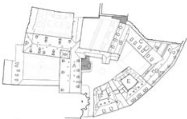
STŘECHY - DEFINITIVNÍ PODOBA PROJEKTU

Dvojice obrázků představuje rozdíly mezi podobou střech s vikýři navrženými původně ateliérem Omicron-K a podobou střech s vikýři vzešlými z požadavků NPÚ podpořenými KZSP. Označení objektů areálu písmeny odpovídá projektu. Hlavní změny projektu prosazené zástupci Klubu Za starou Prahu jsou: 1) v objektu A – zachování souboru barokních dveří ve druhém patře konventních budov in situ, 2) v objektu B – zachování dřevěných stropů a větší části dispozic v prvním a druhém patře, 3) v objektu D – zachování originálu barokního schodiště do prvního patra; přesun zásobovacího výtahu do prostoru dvora, díky čemuž nedojde k průrazu renesanční klenbou.