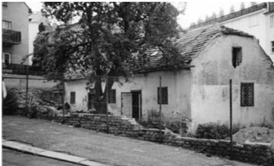
Usedlost Závěrka, Břevnov čp. 338, v roce 1998, kdy byl již zdevastován dřevěný plot i vnitřek.