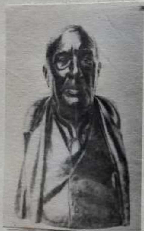
Busta Vendelína Budila od sochaře Hrušky.