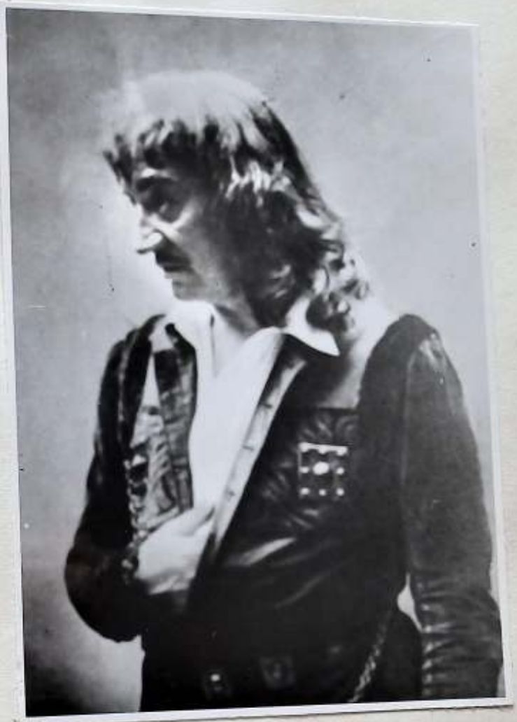
"Být či nebýt-to jest otázka .."