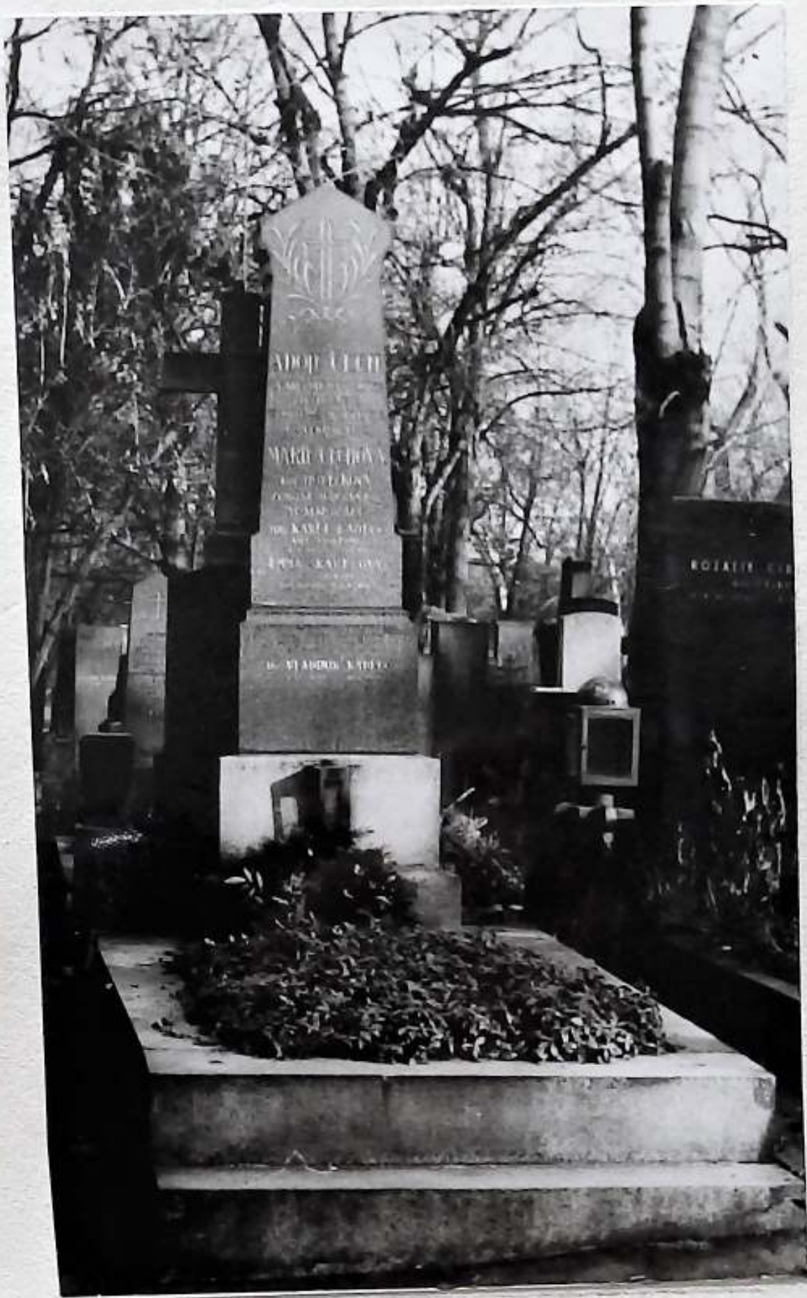
A d o l f Č e c h