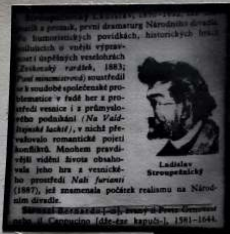
Průruční slovník cs. AV.

Jako dramaturg byl však velice neoblíbeným. Nikomu se neklanel, odmítal špatné a slabé hry a získával tak mnoho nesmířitelných nepřátel. Když ve svých 43 letech umíral napsala o něm Hana Kvapilová: "Jsem dnes tuze stísněna, dramaturgovi je tuze zle a mně je ho nesmírne líto. Mezi těmi divadelními povahami byl on prece jenom povahou. Dostí zamezil zla, mohlo by bez něj býti ještě hůr. Nedopustil prece, aby jedovaté býlí vlivu příliš bujelo a nedalo-li se už vyhubit, prece jen omezil přílišné zakorenení".