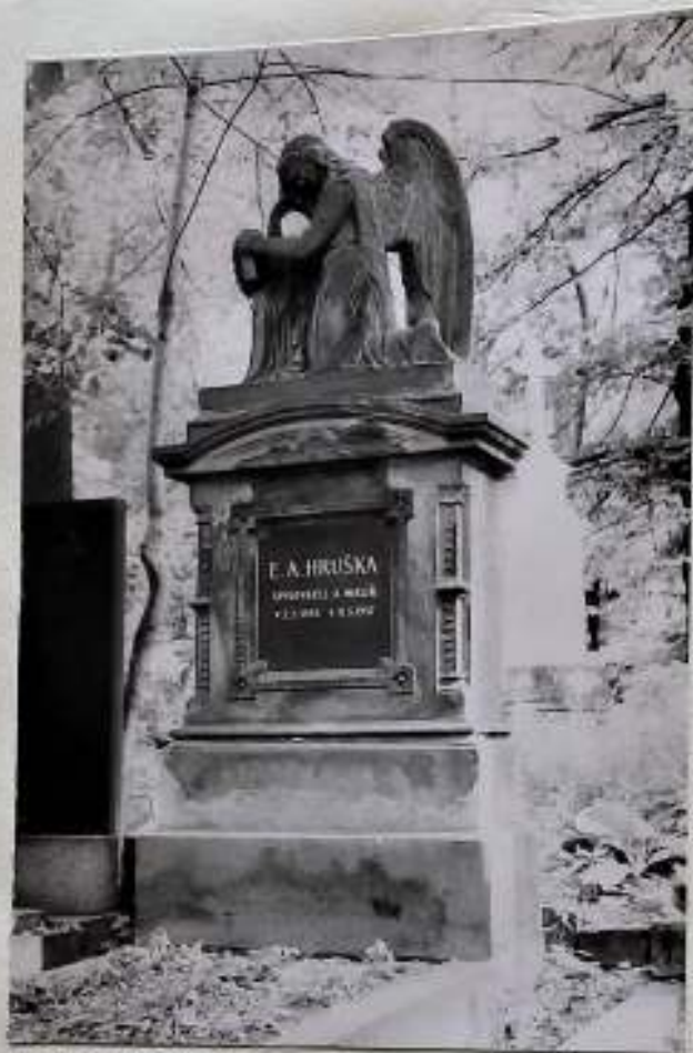
Autor knihy Romantické Olsany.