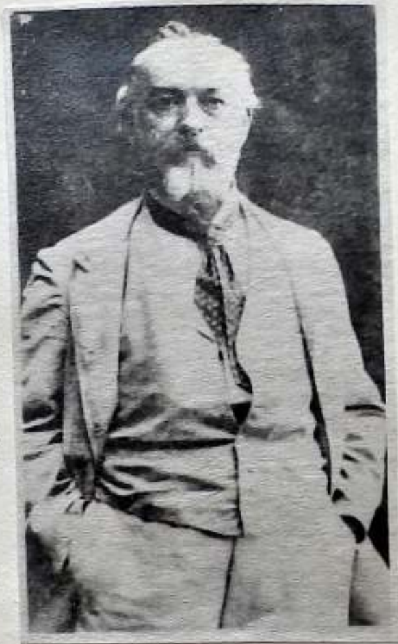
O l š a n y V. hřbitov oddělení 25 hrob číslo 8a.

Náhrobek je z pískovce. V po- zadí je mohyla bášníka Šeb. Hněvkovského, vpředu vede ce- sta k památníku České obce sokolské.