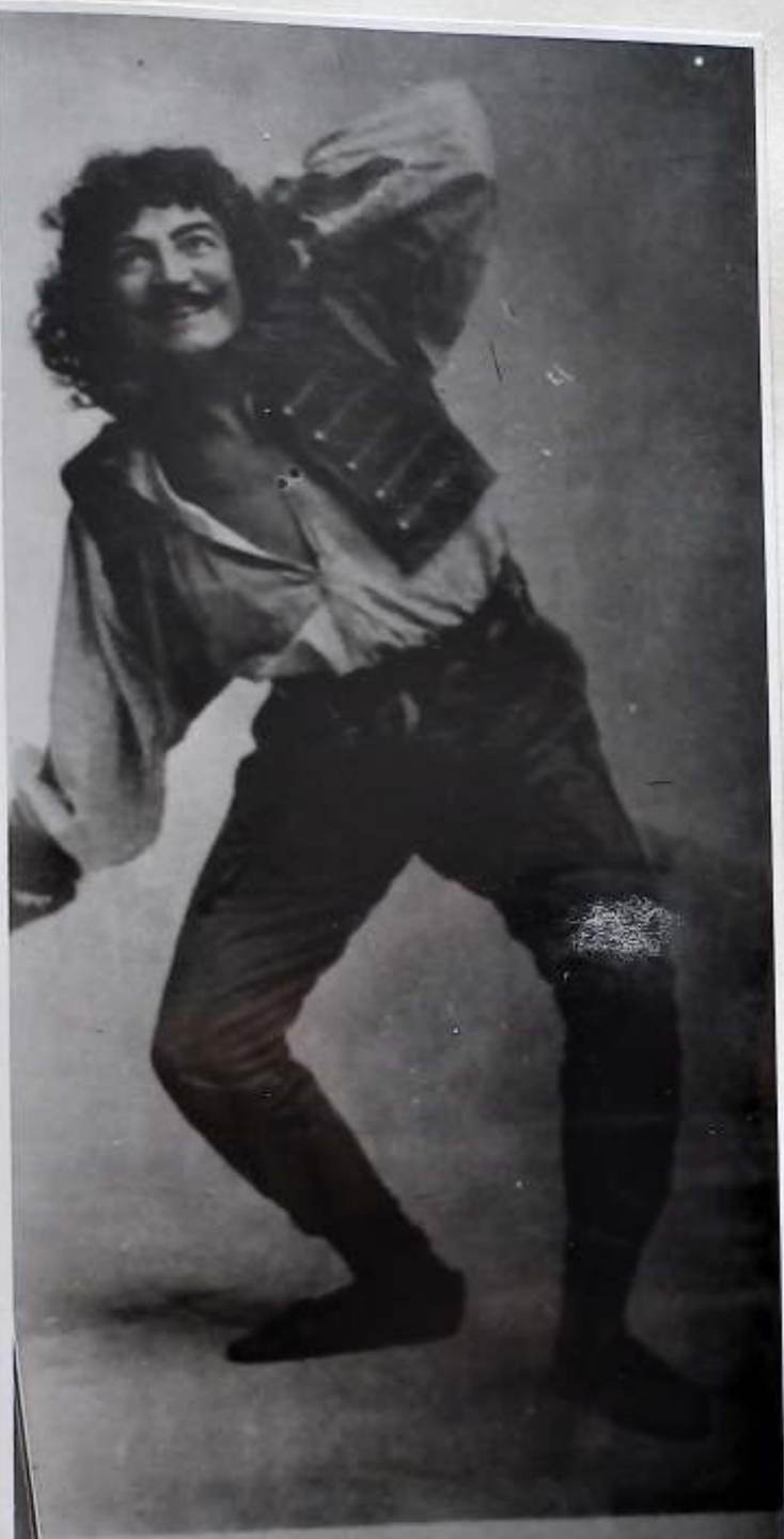
anovy hry „Byl jednou jeden král“ (1900)